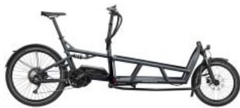
Wir warten auf das neue Load 75-Lastenrad