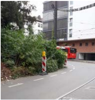
Büsche Südunterführung

Wer mit dem Rad in letzter Zeit durch die Südunterführung am Bonner Hauptbahnhof gefahren ist, hatte - wie übrigens in früheren Jahren auch - monatelang ein Problem. Wer den Schutzstreifen nutzen wollte, musste sich zuletzt im wahrsten Sinne des Wortes durch die Büsche schlagen, denn dieser war komplett zugewachsen.