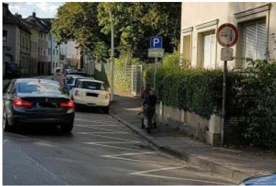
"Überholverbot von Zweirädern" - Pastoratsgasse, Bonn