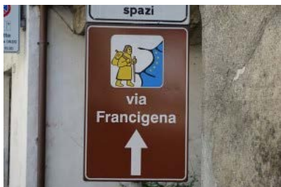
Von Basel nach Rom

Bonn: Kreative Köpfe für Mobilitätswende gesucht. Bonn will bis 2030 die CO 2 -Emissionen um mindestens 40 Prozent senken und bis 2035 klimaneutral werden. Zur Umsetzung der Mobilitätswende und des Radentscheids sucht die Stadt Bonn nun Planer*innen und Bauingenieur*innen für die Entwicklung zukunftsfähiger Konzepte und Strategien. Idealerweise mit abgeschlossenem Hochschulstudium im Verkehrswesen, Stadt- und Regionalplanung oder Geografie. Bewerbungsfrist endet am 26.11. 2021. Mehr Informationen zu den Stellenausschreibungen