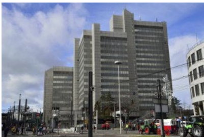
Es gibt Arbeit für die Verkehrswende: im Bonner Stadthaus