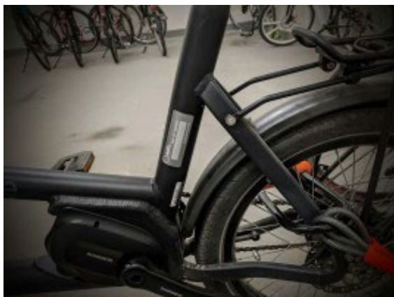
Codiertes Fahrrad