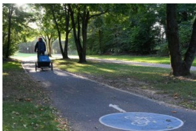
Auch auf Beueler Seite schmale Radwege