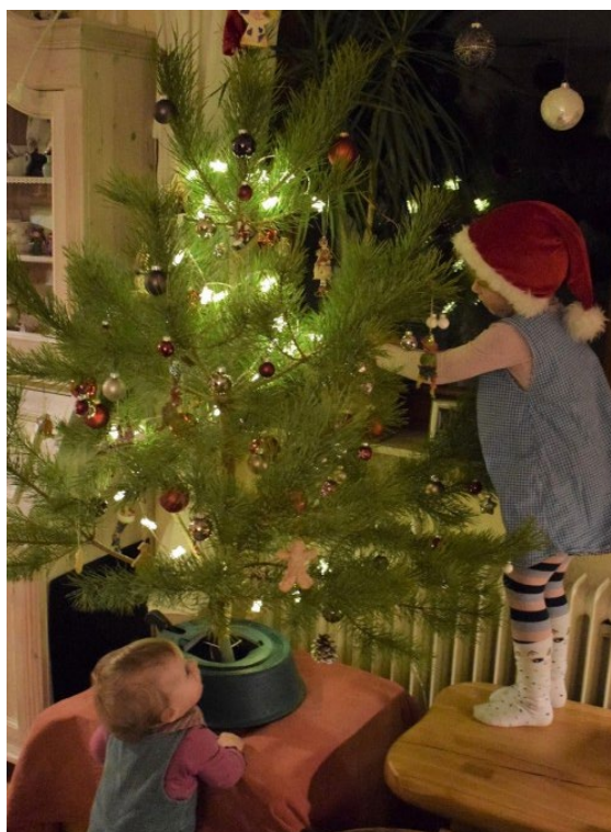
Weihnachtswichtel gesucht

Im RadHaus wird ab sofort wieder dienstags und mittwochs auch ohne Termin codiert (17-19 Uhr). An Freitagen (11-13 Uhr) und Samstagen (11-14 Uhr) weiterhin nur mit Termin. Terminvereinbarungen am besten per Mail .