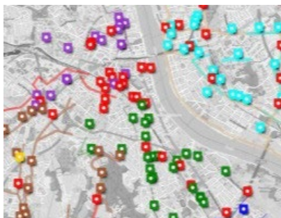
Hier gibt es kurzfristig umsetzbare Verbesserungsmöglichkeiten