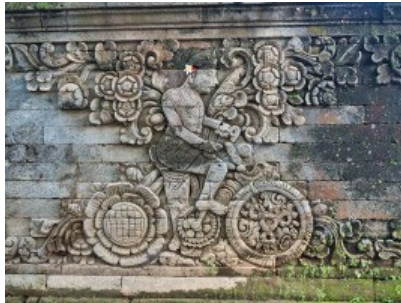
Relief auf Bali mit einem Fahrradfahrer