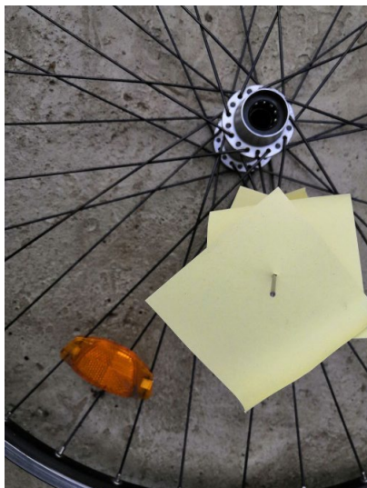
Aufgespießt © Bernhard Meier