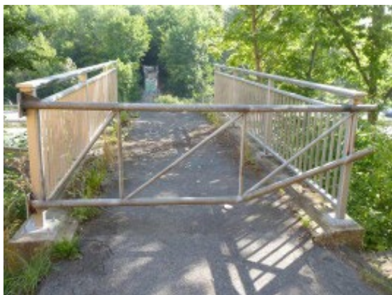
Fußgängerbrücke Meckenheim-Merl