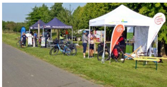
Apfelroutenpicknick 2021

Wir wollen wieder eine ADFC-Weihnachtsfeier feiern! Außer einer verlässlichen Aussicht auf die Coronalage fehlt uns allerdings auch ein Team, das die Organisation der Feier in die Hand nimmt. Aktive aus früheren Jahren unterstützen gern. Wer Lust hat, sich hier einzubringen, melde sich gern per Mail ! Als mögliche Termine haben wir schon mal die Freitage 3.12. und 10.12. ins Auge gefasst.