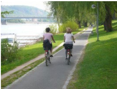
Rheinaue Bonn

Wenn die Stadt Bonn das Projekt weiter verfolgen will, muss die Verwaltung ihre Pläne nun überarbeiten und eine genehmigungsfähige Form vorlegen. Ein schwieriges Unterfangen, selbst wenn es gelingen sollte, eine Fristverlängerung im Rahmen des Förderprogramms "Emissionsfreie Innenstadt" zu erlangen. Siehe hierzu auch unsere Pressemeldung .