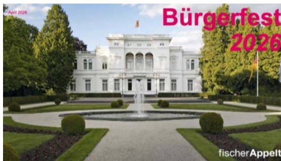
Bürgerfest im Garten der Villa Hammerschmidt