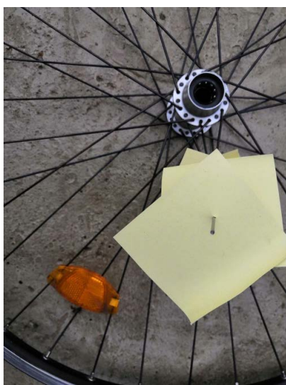
Aufgespießt