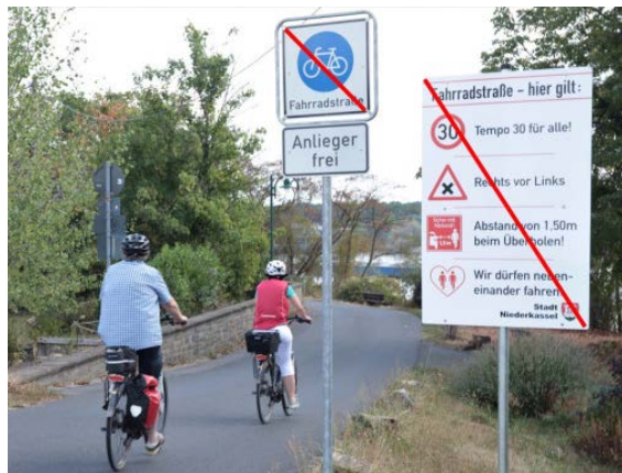
Entwicklungen in St. Augustin

Zahlreiche Unternehmen und Initiativen stellen gemeinnützige Projekte aus den Bereichen Kultur, Bildung, Umweltschutz u.a. vor. Der Eintritt zum Bürgerfest ist kostenfrei.