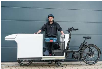
Jetzt umsteigen auf Lastenrad

platzsparendes, flexibles und stau-unabhängiges Transportmittel bietet sich jetzt besonders an. Die gewerbliche Anschaffung eines Transportbikes wird zurzeit auch gefördert. Hierzu gibt es diese Info vom NRW-Wirtschaftsministerium .