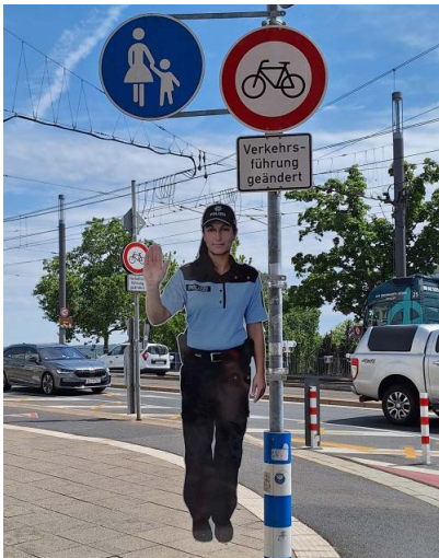
Nur noch eine Richtung für den Radverkehr