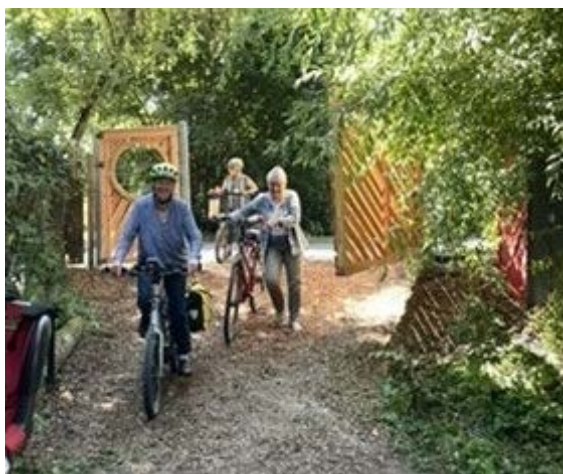
Nach der Tour ist vor dem Picknick