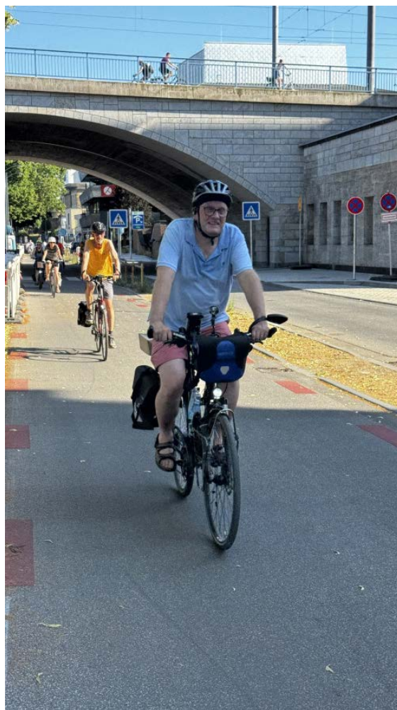
Einige Hartgesottene trafen sich trotz brütender Hitze zur Tour. Später im Biergarten wurden es dann deutlich mehr

Für eine Systemumstellung im Herbst benötigt das IT-Team des ADFC Bonn/Rhein-Sieg noch Hilfe. Wir suchen Menschen, die Erfahrung im Bereich NextCloud und/oder EDV-Schulungen haben und uns unterstützen wollen. Bei Interesse schreibt uns eine Mail .