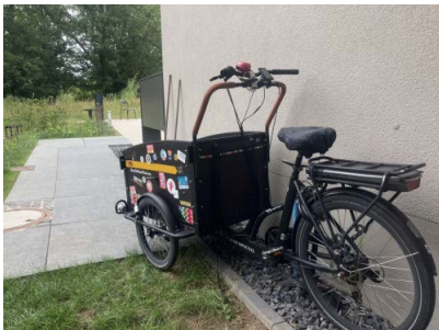
Maikes Lastenrad sucht einen Parkplatz in Bonn

Einige Fahrradläden übernehmen beim Kauf eines Pedelecs die Kosten für einen solchen Kurs. Fragen Sie einfach bei Ihrem Radladen nach!