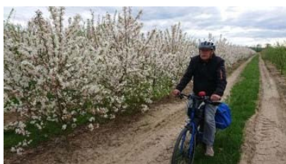
Biken auf der Rheinischen Apfelroute.

Hier geht es zu allen wichtigen Fahrrad-Terminen im April. Es sind auch wieder viele ADFC-Aktionen mit Codiermöglichkeiten dabei!