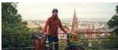
Cycling Cities

Oder noch auf der Suche für etwas Inhalt im Osternest? Dann unser Tipp: Radfahren – eine Soziologie aus dem Sattel. Das Fahrrad als Haustier, Gesetzesbrecher und Lebensstilkone, Christian Stegbauer, SpringerNature, Heidelberg 2025, 232 S., Hardcover € 24,99, ISBN: 978-3-658-48166-7.