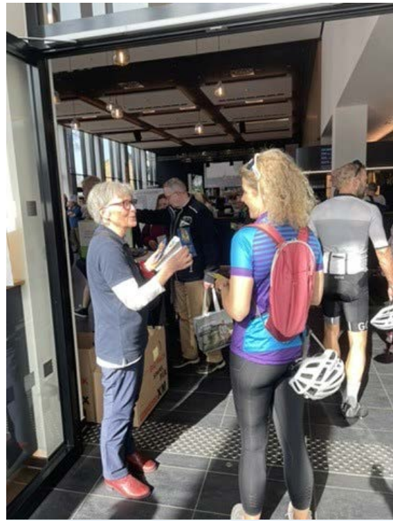
Trubel am Messeeingang