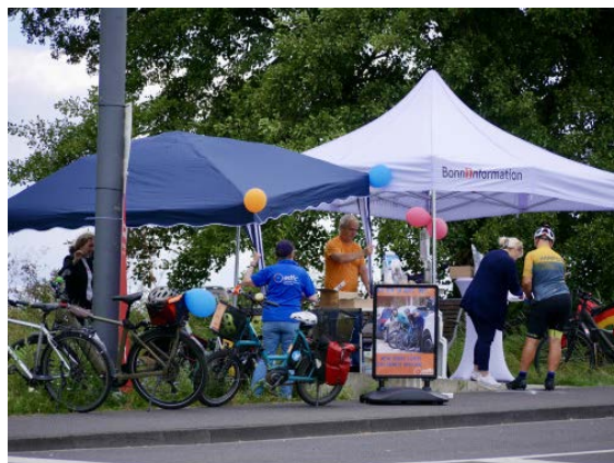
ADFC-Ehrenamtliche an Infoständen

Es werden für beide Märkte noch Helfer*innen gesucht, insbesondere für den Auf- und Abbau. Bei Interesse oder Fragen zum Markt melde Dich per Mail .