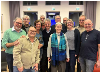
Aktueller ADFC-Vorstand